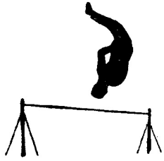
Päuli als Sturzflüger! (nach der Marktbörse)