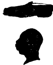
warum chunst au nu öpe emal cho turne